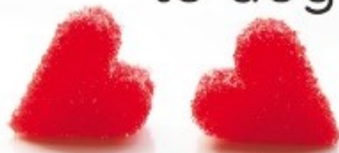
cuori di zucchero