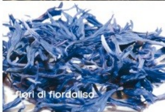
flori di fiordaliso