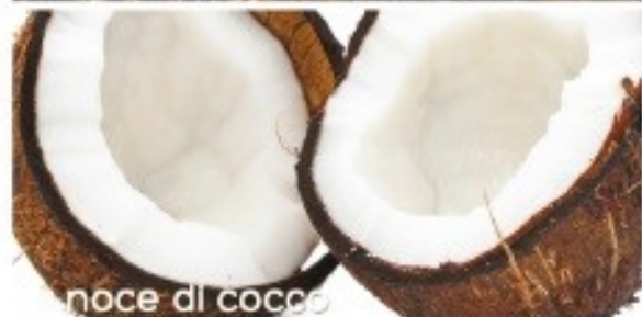
noce di cocco