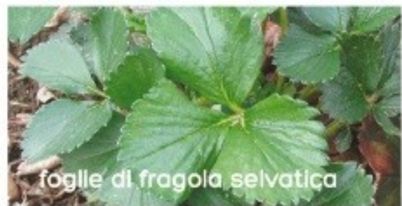
foglie di fragola selvatica